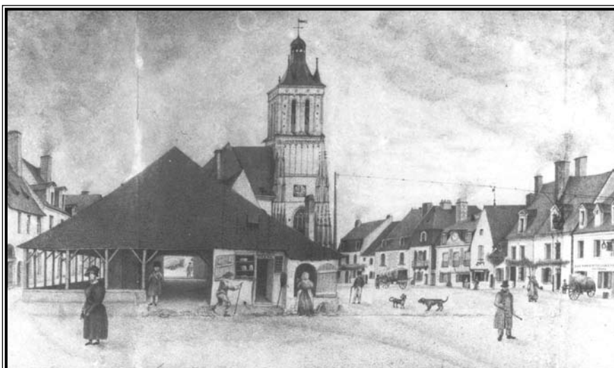
Anciennes halles XV e Siècle, musée Joseph Denais

La halle elle-même, constituée d'une travée centrale correspondant aux deux portes latérales, à partir de laquelle se développent symétriquement six travées délimitées par douze arcs et pieds-droits en maçonnerie de tuffeau, représente un